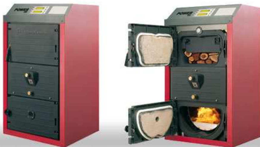
EDILKAMIN ENERGY de FLAMA INVERTIDA